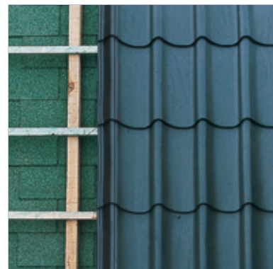
Renovatie op gebitumeerde ondergrond

Bij singel- en bitumdaken kan de dak-op-dak-methode toegepast worden.