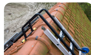
Crochet pour faîtière adaptable à toute échelle Solide